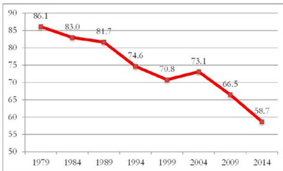
Fig. 1 – Andamento della partecipazione al voto alle europee nel territorio nazionale, 1979-2014

Questo dato italiano si inserisce in un quadro europeo in parziale controtendenza: nel complesso dell'Unione la partecipazione ha tenuto, rimanendo stabile attorno al 43%. L'Italia rimane uno dei paesi con la più alta affluenza alle urne, ma il gap dal resto d'Europa si è ridotto.