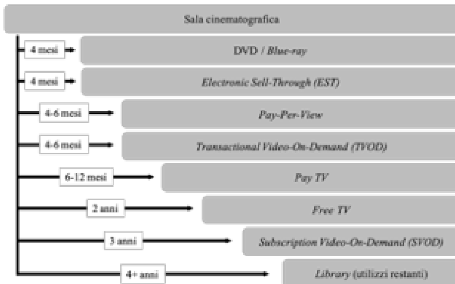
Fig. 1. Sequenza delle finestre di sfruttamento delle opere cinematografiche in Italia, secondo la prassi di mercato.

L'ingresso nel mercato nazionale degli operatori c.d. OTT (in particolare di Netflix) e la loro crescente attività di produzione di contenuti audiovisivi, film compresi, ha portato allo sviluppo di strategie distributive in contrasto con la prassi consolidata delle finestre, suscitando forti polemiche da parte dell'industria nazionale. Il casus belli è il film "Sulla mia pelle" di Alessio Cremonini: prodotto da Netflix e finanziato dallo Stato per un importo pari a circa 600.000 euro, il 12 settembre 2018, dopo la sua proiezione alla 75° Mostra Internazionale d'Arte Cinematografica di Venezia, viene distribuito contestualmente sia nelle sale cinematografiche che sulla piattaforma online [14]. Ciò in violazione della regola di mercato che, come visto, richiede un termine di circa 3 anni tra l'uscita di un film in sala e la sua comparsa su una piattaforma SVOD .